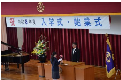
令和8年度 新入生代表

先生がた、先輩がた、これから立派な東中生になれるようご指導くださいますようお願いいたします。