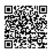
「ラーケーションの日」活動事例集