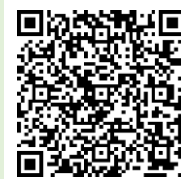
「ラーケーションの日」ポータルサイト

「ラーケーションの日」には、様々な活動ができます。どのような活動ができるのか、どうやって「ラーケーションの日」を取ればよいのかなど、興味をもった人は、おうちの方に配った「保護者用リーフレット」を見たり、右の二次元コードから、「ラーケーションポータルサイト」の「『ラーケーションの日』活動例」を見たりしながら、おうちの方と話し合ってください。